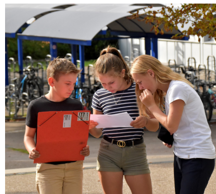
Impressionen von der Einschulungsfeier der 5. Klassen