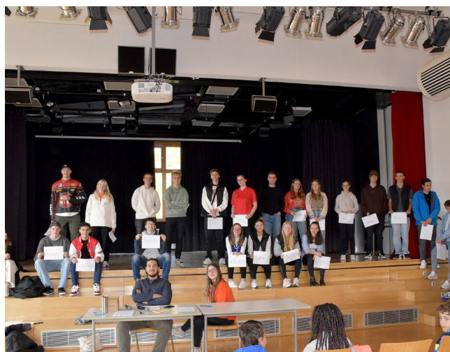
Der Schülerrat konstituierte sich am 07. Oktober 2022 in der Aula