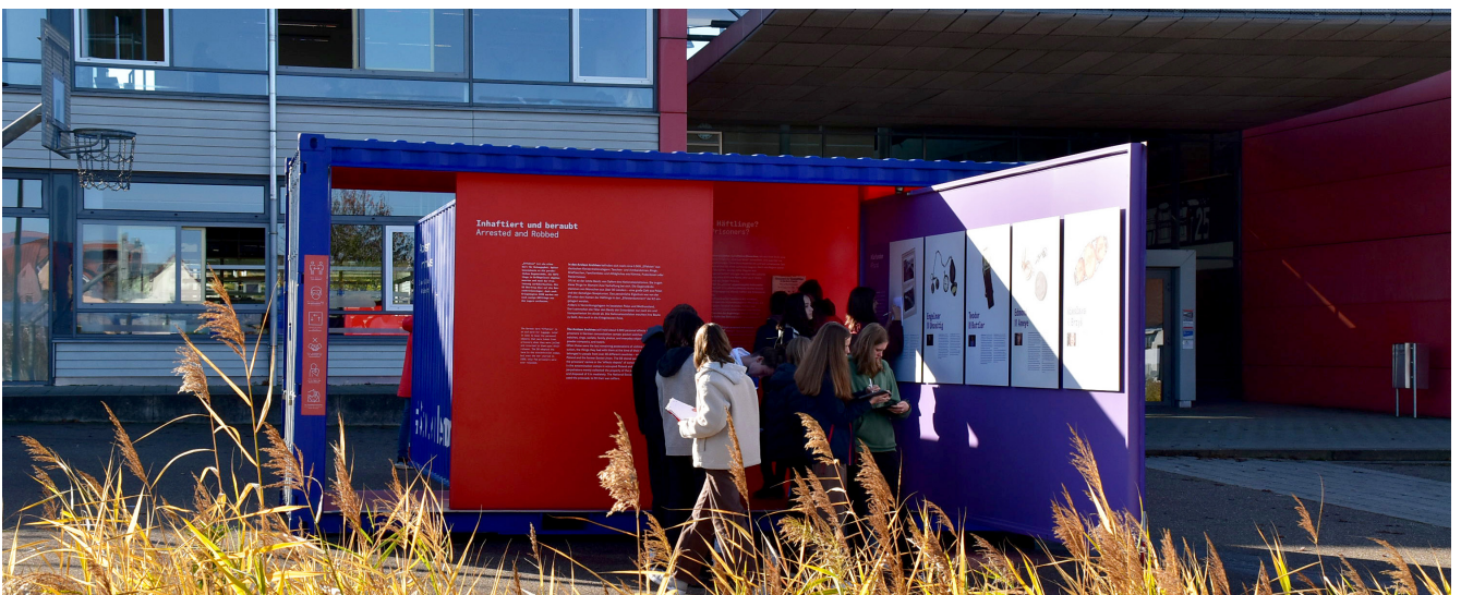
Klasse 10b beim Ausstellungsbesuch mit Arbeitsauftrag