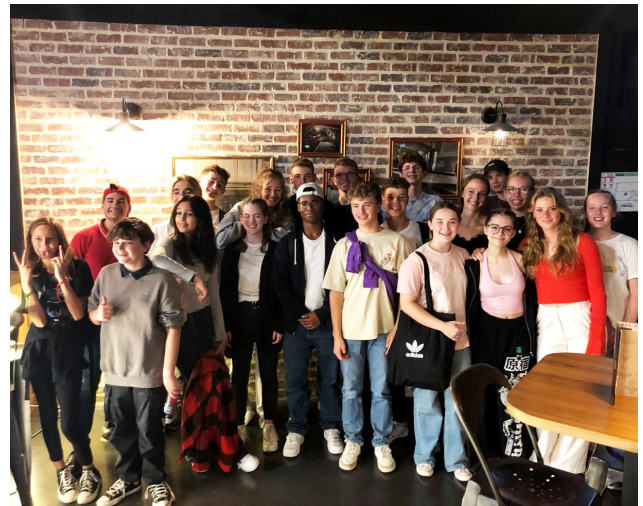
Deutsch-französische Begegnung beim Bowlen im Jugendzentrum