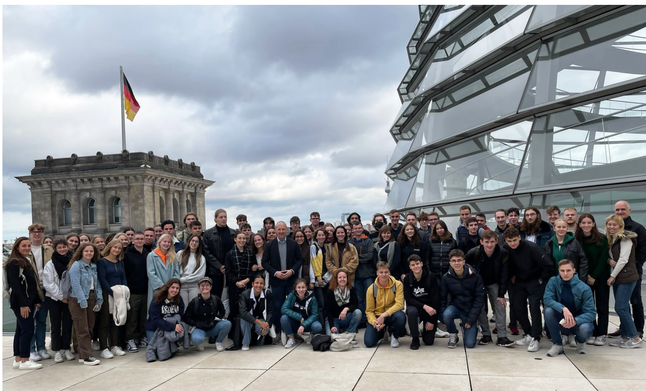
Die Kursstufe J2 begrüßt vom Dach des Reichstagsgebäudes - in ihrer Mitte der Bundestagsabgeordnete Marc Biadacz (CDU)