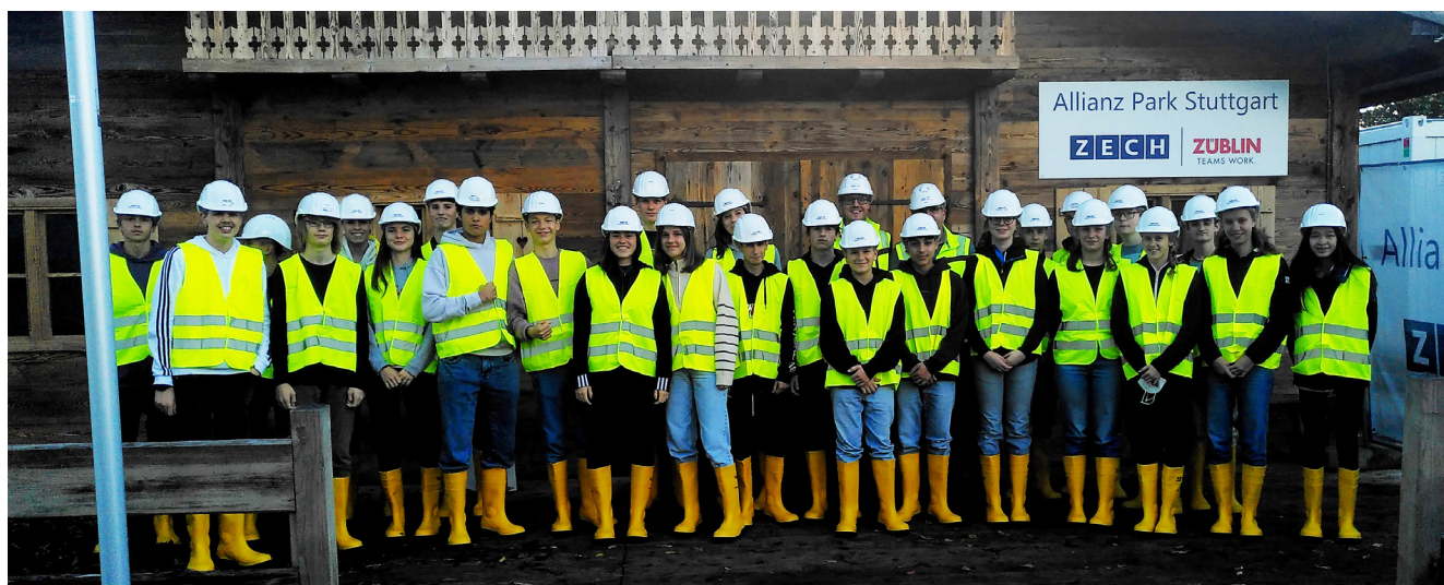
Am Projekttag Arbeitswelt in Klasse 10 besuchte eine Gruppe die Firma Züblin auf einer Baustelle