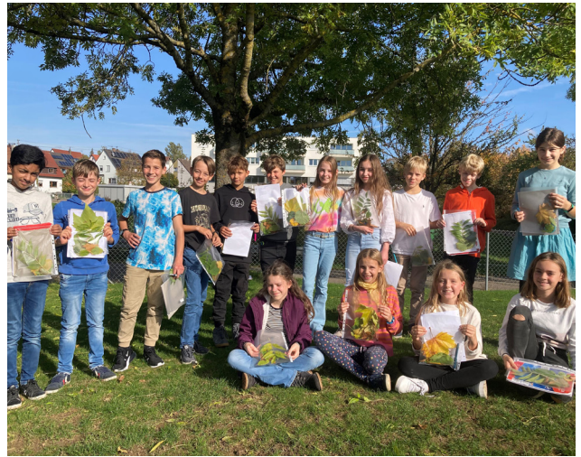
Blättersammlung für die Herbarien der Klasse 6a