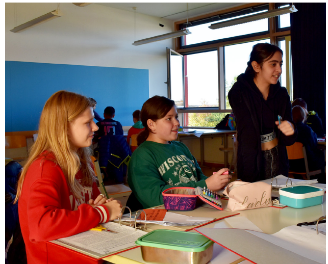
Klasse 7 beim Methodentraining am 24./25.10.2022 zum Thema „GFS für Newcomer“