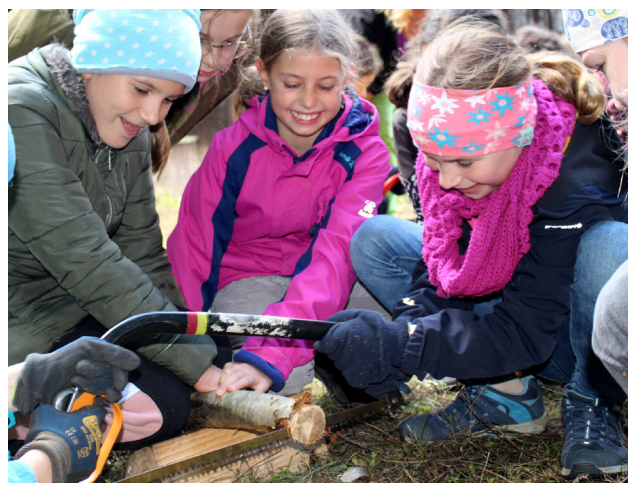
Klasse 5d sägt Holzscheiben für ihr gemeinschaftliches Kunstwerk