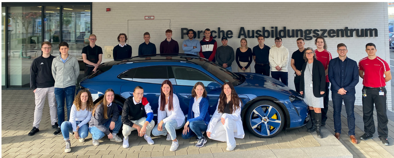
Die Schülerinnen und Schüler des Wirtschaftskurses J2 am Ende ihres Besuchs im Porsche Ausbildungszentrum in Stuttgart