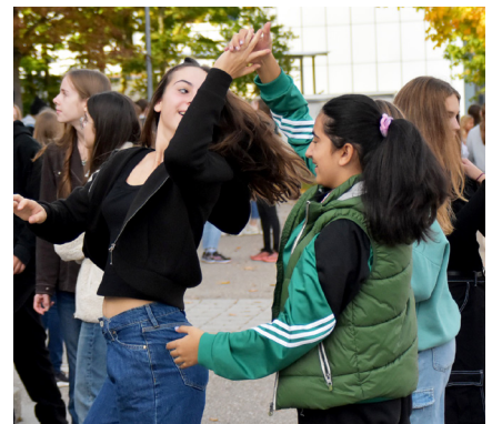
Impressionen vom Pausenkonzert