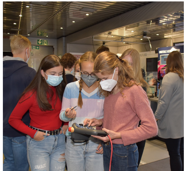
Schülerinnen der Klasse 10a beim Testen von Bauteilen