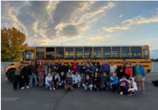
USA Boise - Centennial High School