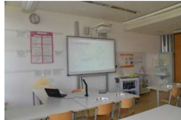
Fachräume, z.B. Mathematik