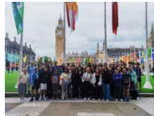
Sprachfahrten und Austausch nach Großbritannien

Austauschprogramm für Klassenstufe 10, unterstützt von Erasmus +