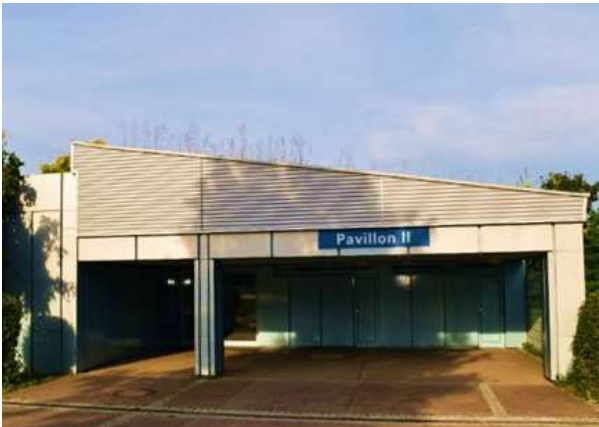
Pavillons mit Klassenzimmer Klasse 5