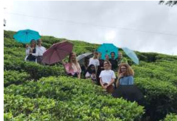
Indien Kerala - Sacred Heart School